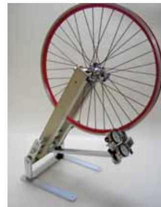
◀ Model tafelrek met helling