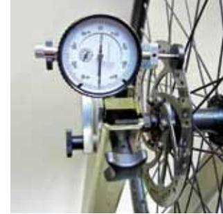
Meetinstrument remschijven alleen model Comfort