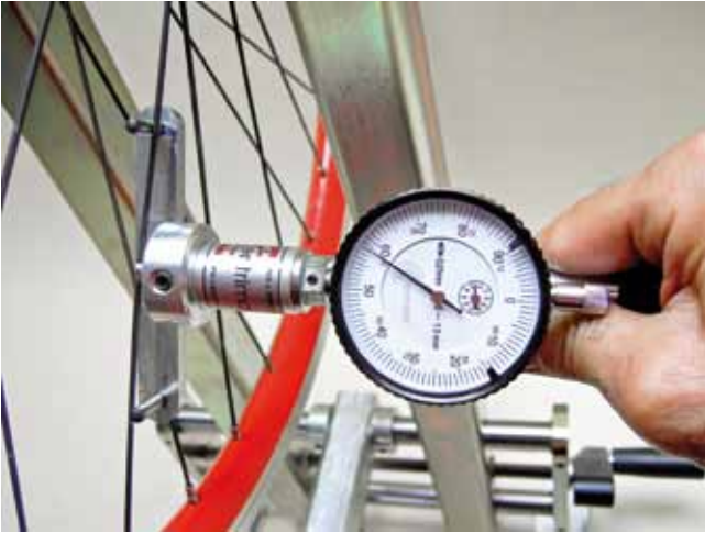
Tensiometer mit Kalibrierliste, auch für Messerspeichen