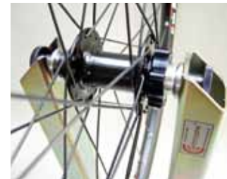
Aufnahme für Steckachsen Universal bis D 28mm