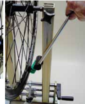
Abdrückfunktion nur Modell Comfort